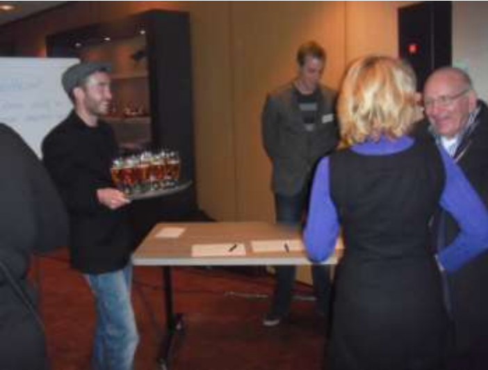
Foto-impresie van de avond